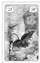
Nr. 23 Ratte Verluste Ängste Krankheiten