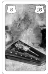
Nr. 8 Sarg Gesundheit Krankheiten