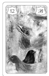
Nr. 12 Vögel Kleiner Kummer vorübergehend