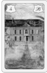
Nr. 4 Haus Häuslicher Bereich / Heim