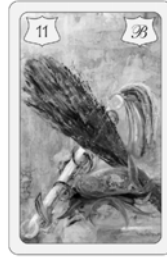
Nr. 11 Rute Ärger / Streit