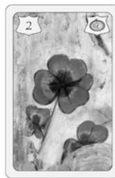
Nr. 4 Haus + Nr. 11 Rute + Nr. 2 Klee Häusl Bereich Streit Glück