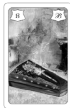
Nr. 8 Sarg Gesundheit Krankheiten

Bei den so genannten Negativ-Karten handelt es sich um die folgenden Lenormand-Karten: